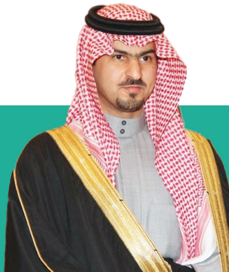
صاحب السمو الملكي الأمير سعود بن بندر بن عبدالعزيز آل سعود نائب أمير المنطقة الشرقية