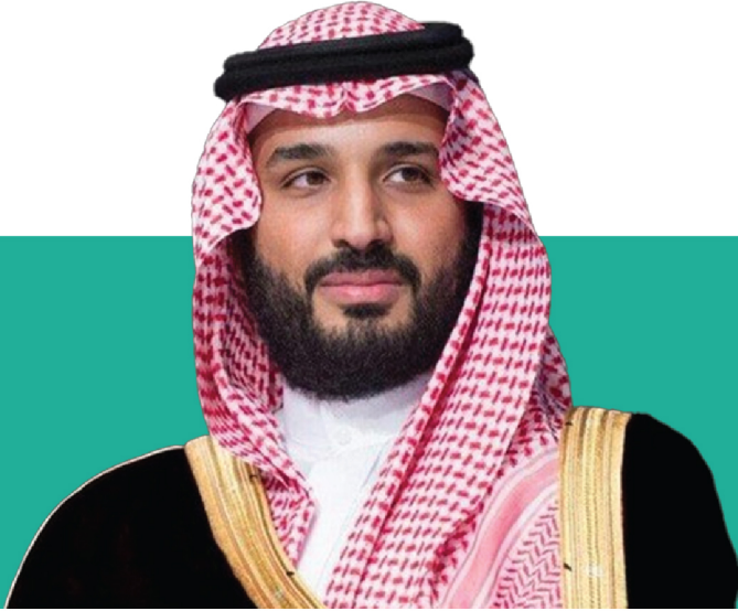
صاحب السمو الملكي الأمير

الإمير محمد بن سلمان بن عبدالعزيز آل سعود