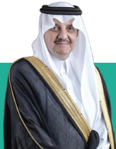
صاحب السمو الملكي الأمير سعود بن نايف بن عبدالعزيز آل سعود أمير المنطقة الشرقية