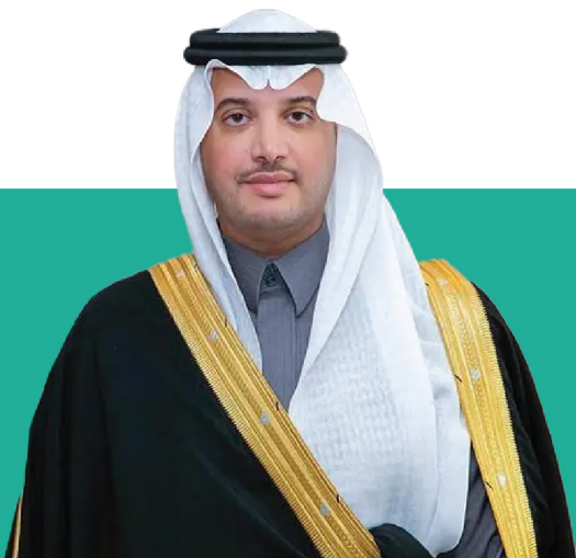
صاحب السمو الملكي الأمير سعود بن طلال بن بدر آل سعود محافظ الإحساء